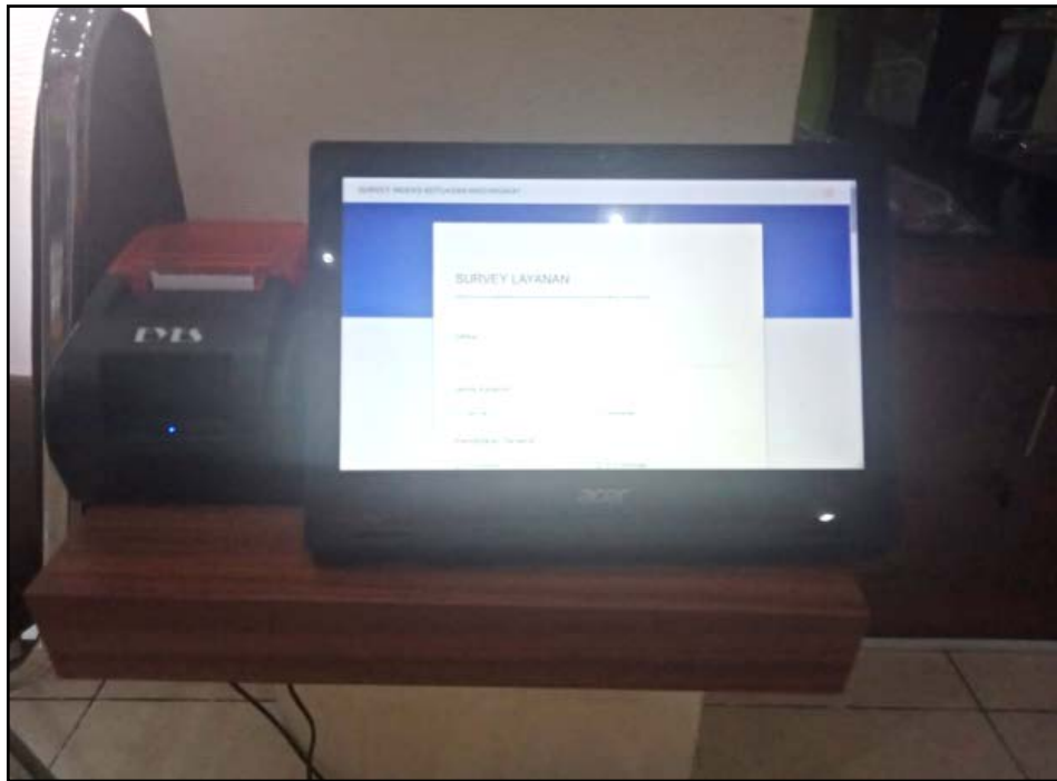
Gambar Aplikasi IKM Secara Online

Aplikasi survey Kepuasan Masyarakat offline dengan icon smiley dirasa kurang mengenai sasaran karena dari ke-9 (sembilan) pertanyaan tersebut diwujudkan dalam 1 (satu) icon smiley sehingga petugas kesulitan menganalisa di pelayanan bagian mana yang dirasa masih kurang. Aplikasi secara offline tadi kemudian diganti secara online mulai bulan Mei 2019 dan model pertanyaan berbasis icon smiley tidak lagi dipergunakan. Aplikasi Survey Kepuasan Masyarakat dapat diakses melalui laman http://jogja-terpadu.kemenkumham.go.id/sipuas/ .